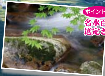
ポイント2 名水百選に 選定された千種川