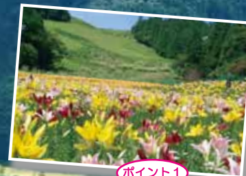
ポイント1 ちくさ高原 ネイチャーランド