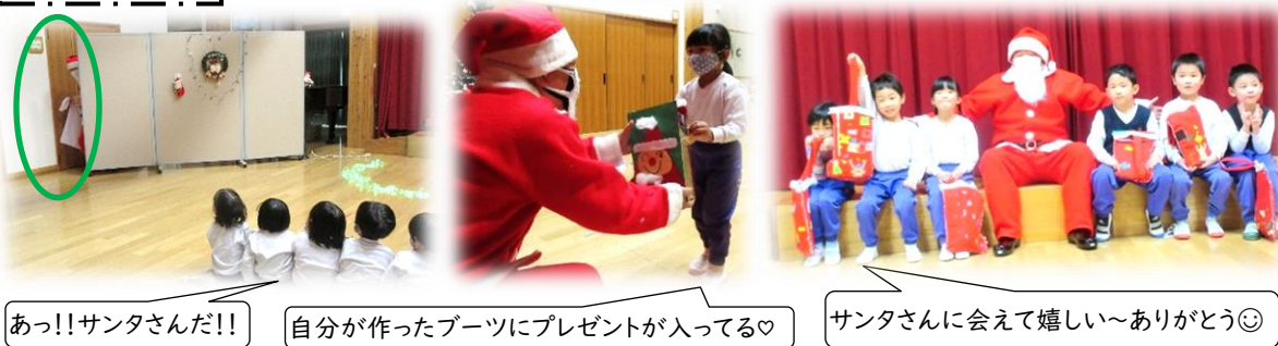
あっ!!サンタさんだ!! 自分が作ったブーツにプレゼントが入ってる♡ サンタさんに会えて嬉しい~ありがとう♡

クリスマス会 「今年もサンタさん来てくれるかな？」とクリスマス会を楽しみにしていました。サンタさんの姿が見えると大喜び！子ども達からの質問にわかりやすく答えて下さいました。