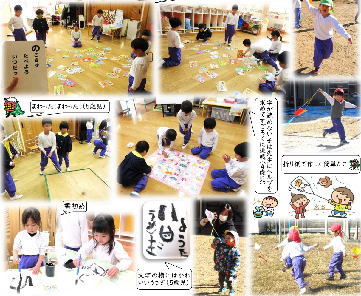
異年齢児でかるた取り(3・4・5歳児) のこさず たべよう いっただい まわった!まわった!(5歳児) 字が読めない子は先生にヘルプを求めてすこくく挑戦(4歳児) 折り紙で作った簡単なこ 書初め 文字の横にはかわいいうさぎ(5歳児)