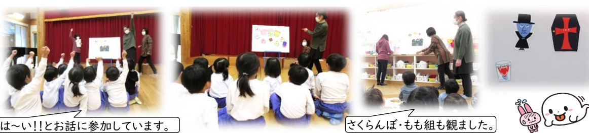
は~い!!とお話に参加しています。 さくらんぼ・もも組も観ました。

みんなでわくわく事業 社協から毎年、歳末たすけあい募金配布金を活用し、児童の子ども達に児童劇を鑑賞できる機会を提供していただいておりますが、今年度も新型コロナウイルス感染症予防のため、人形劇鑑賞は中止ですが『おばけマンション』と、『くいしんぼおばけ』のパネルシアターをいただきました。子ども達はおばけが怖いのに大好き、早速興味津々観ていました。