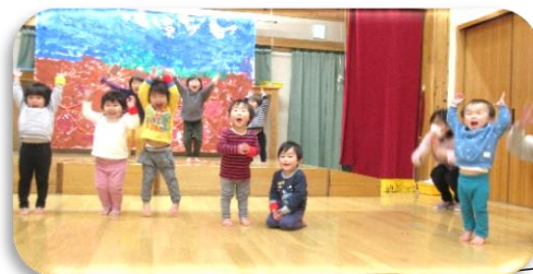
全身で表現して、楽しんでいます。お話遊びのバックもみんなで作りました。 さくらんぼ・もも組(1・2歳児)

みんなで考えて作り上げた劇は、とても素晴らしいものになりました。それぞれの役がかっこよく、面白くて、一人一人が輝いています。あわてなくていいからゆっくり大きな声で、発表することを楽しんでほしいと思ひます。