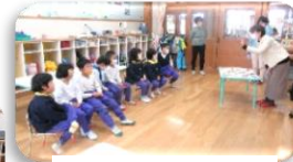
食育問題に答えて、嬉しそう😊