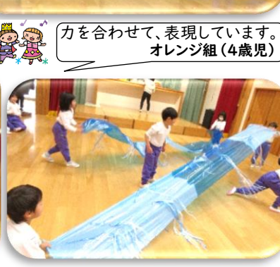
力を合わせて、表現しています。 オレンジ組(4歳児)