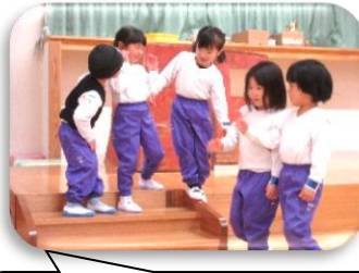
こびとのくつや りんご組(3歳児)