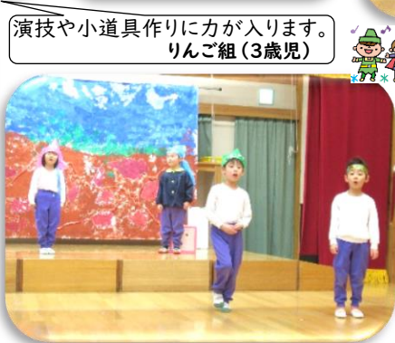
演技や小道具作りに力が入ります。 りんご組(3歳児)