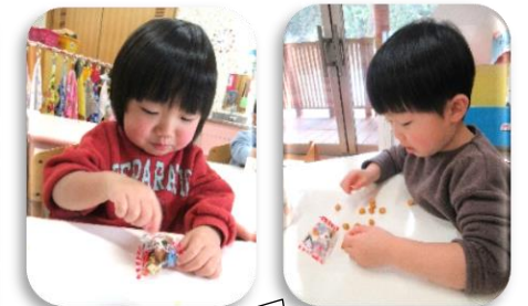
おやつは豆!!ひとつぶひとつぶ上手につまんで食べていました。 さくらんぼ・もも組(1・2歳児)

みんなの代表でメロン組(5歳児)が自分の中の『やっつけた鬼』を発表して、クラスごとに鬼に向かって豆を投げました。力強く「おには〜ぞと!ふくは〜うち!」と言いながら、心の中の鬼を無事退治できました。