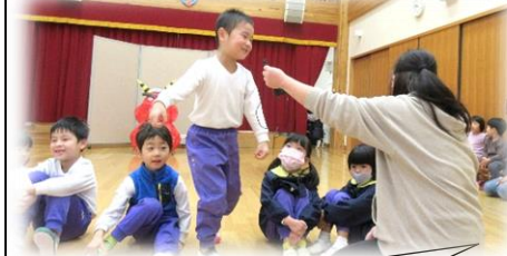
メロン組にインタビュー。 メロン組(5歳児)