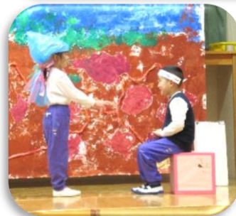
セリフを言う声が大きくなりました。 メロン組(5歳児)