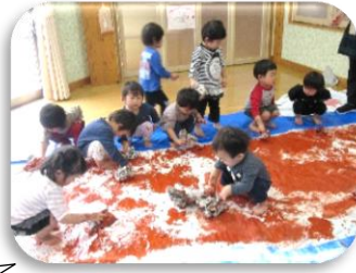
役者がいっぱい!! オレンジ組(4歳児)