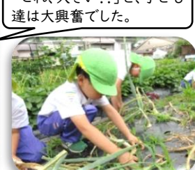
「これ、大きい!!」と、子ども達は大喜びでした。