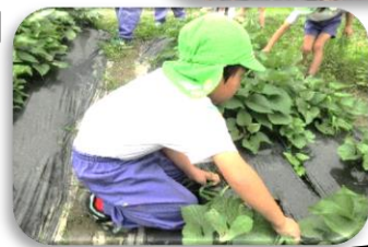
玉ねぎを収穫した後はさつまいもの周りの草取りを頑張りました。