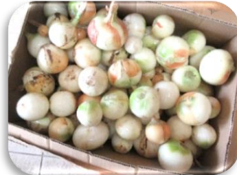
たくさんの玉ねぎを収穫しました。